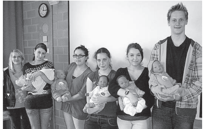
Schülerinnen und ein Schüler der Mildred-Scheel-Schule BB.

Schlafen ebenso wie unterwegs im Bus oder zur Schule. Freizeitaktivitäten wie Kino oder ein Partybesuch werden zu Herausforderungen. Die Reaktionen von Dritten auf die sehr junge Elternschaft fallen teils interessiert teils ablehnend aus.