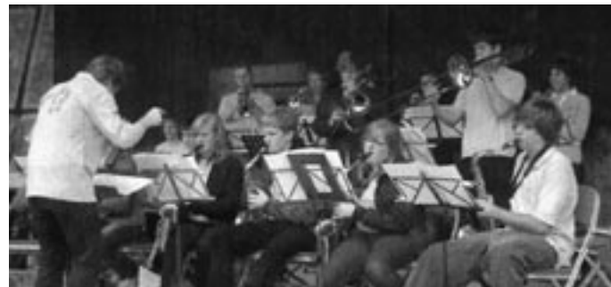
Die AEG-Big Band bei Ihrem Auftritt am 15. Juni 2008 im Hofgut Mauren